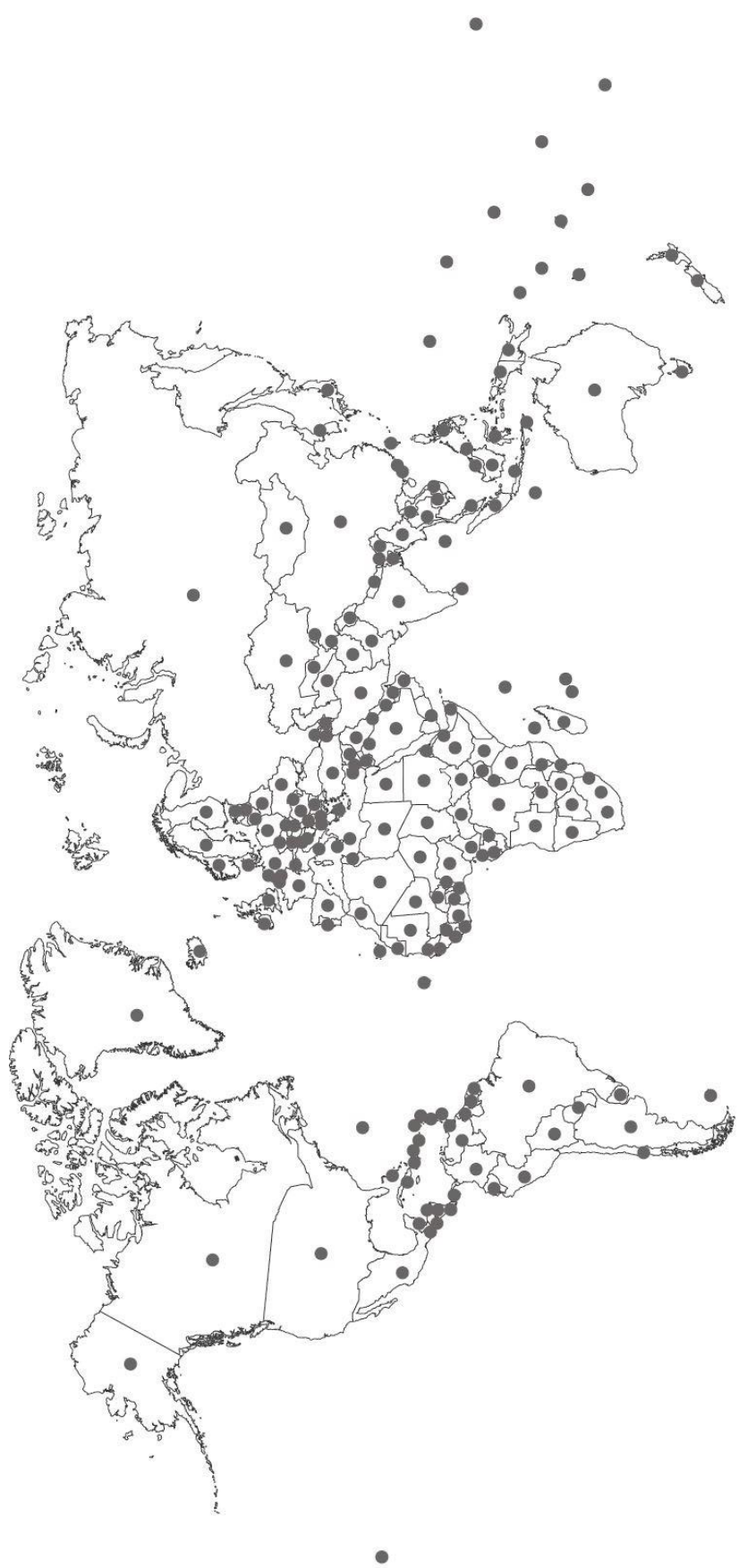
庆祝巴哈欧拉诞辰200周年国家分布图